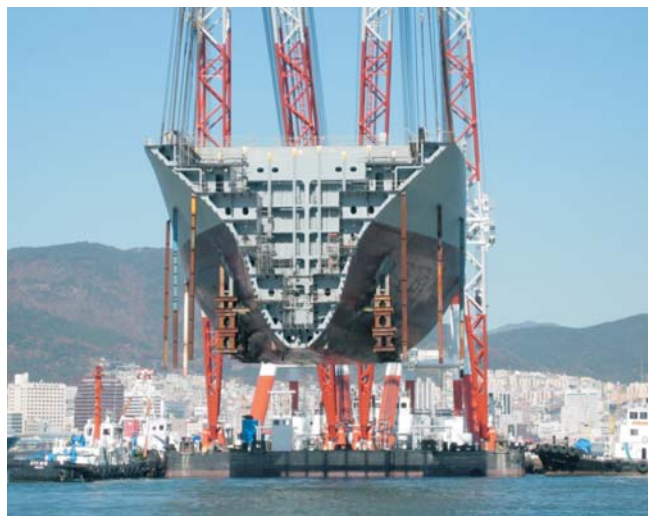
Slika 3 Plovna dizalica brodogradilišta Samsung podiže megablok

Pored velikih megadokova, brodogradilište Samsung Geogje gradi brodove i u dva velika plovna doka dimenzija 450x55 metara i kapaciteta 400 000 dwt. Njih poslužuju dvije velike plovne dizalice nosivosti 3500 i 3000 tona, 96 metara visine dizanja iznad vodne linije i kraka dizanja od 47 metara, slika 3. Pomoću ovih dizalica afamax tanker je moguće u plovnom doku sastaviti u samo deset modula.