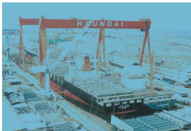
Slika 2 Megadok s goliat dizalicama u brodogradilištu Hyundai HI Ulsan [3]

Figure 2 Megadock with goliath cranes in Hyundai HI Ulsan shipyard