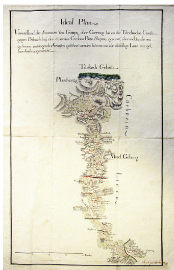
Idealplan, vorstellend die Situation von Gospiz über Coreniza bis an die Türkische Confyn gegen Bihach bey dem äussersten Cordonsposto Skipina genannt [Idealni nacrt, koji prikazuje pregled stanja od Gospića preko Korenice sve do osmanske granice prema Bihaću kod posljednje kordonske postaje zvane Skipina] (Österreichisches Staatsarchiv, Beč: Finanz- und Hofkammerarchiv)

Osamnaesto stoljeće obilježeno je brojnim projektima izgradnje prometnica na teritoriju južno od Kupe. Primarni inicijatori tih projekata na Bečkome dvoru bili su inženjeri Trgovačkog vijeća i Dvorskog ratnog vijeća.