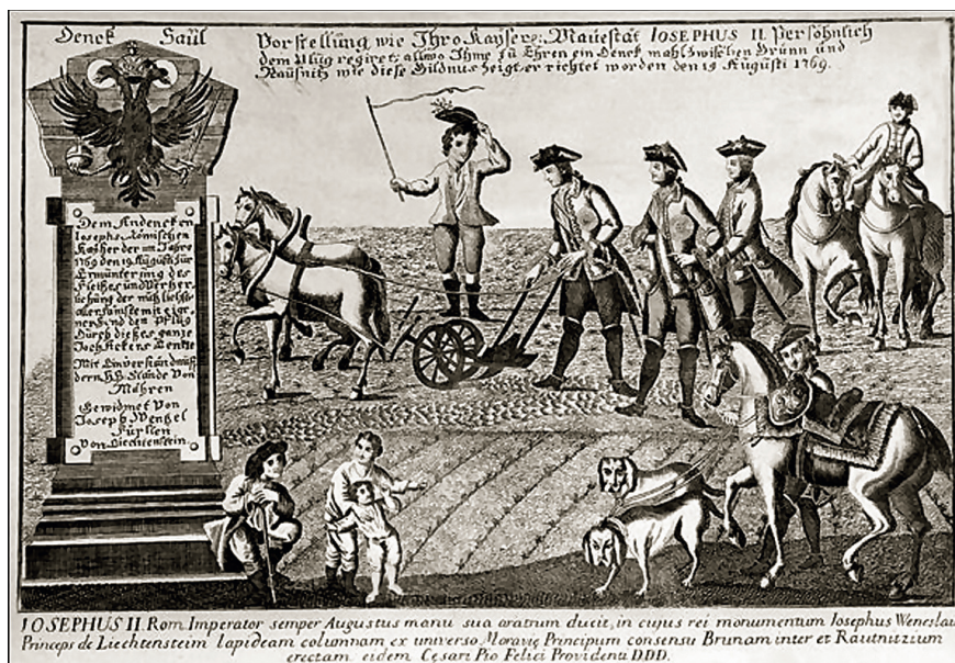
JOSEPHUS II. Rom. Imperator semper Augustus manu sua aratrum ducit, in cuius rei monumentum Josephus Wenzlaus Princeps de Liechtenstein lapideam columenam ex universo Moravia Principum consensu Brunam inter et Rautnitzum erectam eidem Cesari Pio Felici Provideno DDD.

Car Josip II. bio je jedan od glavnih predstavnika prosvijećenog apsolutizma, a poticanje agrikulturnog napretka bilo je jedno od značajnijih obilježja njegove vladavine. Poznata grafika, koja prikazuje samoga cara Josipa II. za plugom, imala je zadatak potaknuti priznanje agrikulture kao plemenite djelatnosti.