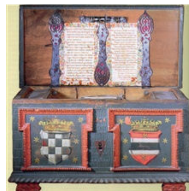
Škrinja privilegija Hrvatsko-Slavonskoga Kraljevstva (Hrvatski državni arhiv, Zagreb)

S druge strane, staleška su poslanstva vladaru predstavljala specifičnost državno-pravnog statusa Banske Hrvatske jer je njima Hrvatski sabor mogao vršiti svoju zakonodavnu ulogu u suradnji s kraljem i izvan Ugarsko-hrvatskoga sabora. Prednost institucije poslanstava ležala je i u činjenici da se ono odašiljalo na inicijativu Hrvatskog sabora, a ne isključivo na inicijativu vladara (kao što se sazivao Ugarsko-hrvatski sabor). Uobičajeno su poslanstvo hrvatsko-slavonskih staleža u Beč činili po jedan predstavnik iz velikaškog, svećeničkog i plemićkog staleža, koji su na Dvoru, kao i u Ugarsko-hrvatskom saboru, djelovali prema uputi staleža i vladaru predstavljali njihove gravamine. S obzirom da je na donošenje kraljevske odluke utjecalo mnogo dvorskih institucija i pojedinaca, zadatak hrvatskih poslanika u Beču nije bio predstavljanje zahtjeva samo vladarici, nego i osobama za koje je Hrvatski sabor zaključio da mogu pružiti podršku staležima. Tako je, na primjer, 1746. Hrvatski sabor uputom poslanicima odredio da u Beču zahtjeve staleža trebaju predstaviti ugarskom kancelaru, dvorskom kancelaru, predsjednicima Dvorskog ratnog vijeća, Dvorske