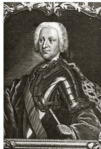
Knez Karlo Josip Batthyány

Knez Karlo Josip Batthyány (1697–1772) obnašao je dužnost hrvatskoga bana od 1742. do 1756. Od 1748. ujedno je i dvorski meštar i odgajatelj nadvojvode Josipa te boravi u Beču. Njegovim je posredovanjem u dogovoru između Marije Terezije i hrvatskih staleža provedena (1749. i 1750) porezna reforma u Banskoj Hrvatskoj.