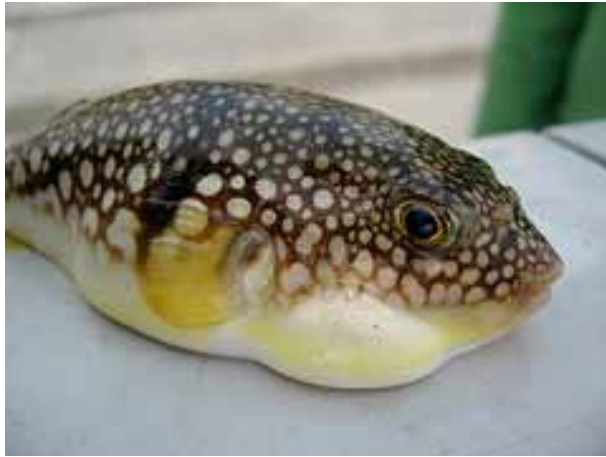
Tipična riba fugu u normalnom stanju