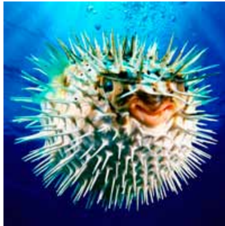
Riba fugu u "uzbuđenom" stanju