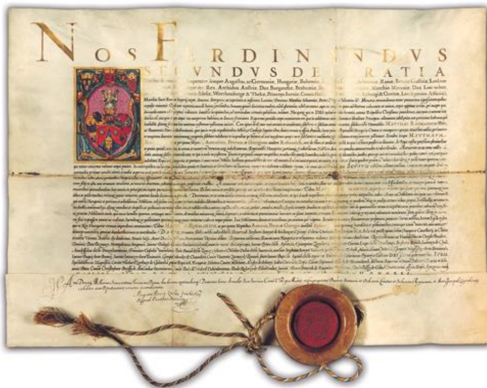
Slika 2. Grbovnica Rožmanić

Beć 1628, rukopis na pergamnetu oslikan videnim bojama, pečat u čašici i od voska pričvršćenim gajtanom, 1 list 47X67 cm, Pomorski i povijesni muzej Hrvatskog Primorja-KPO-PZ 26482, Zbirka Arhivalia, darovao Josip Rožmanić 1935