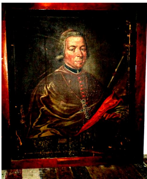
Slika 1. Biskup Smoljanovića

Još uvijek postoje suprotna mišljenja da li je mjesto njegova rođenja Kostrena ili Bakar. Vatroslav Cihlar navodi da je rođen u Kostreni u zaseoku Valentinovo i da ga njegov suvremenik Pavao Riter Vitezović spominje kao Kostrenjanina (Cihlar 1957:25). Mihajlo Sladović također navodi da je biskup Smoljanović rodom iz Kostrene (Sladović 1856:110) Goroslav Oštrić navodi „da je biskup Smoljanović rođen 1633. u Kostreni, ali se uvijek nazivao Bakraninom jer je i Kostrena pripadala župi Bakar“ (Oštrić 1996:55). Suprotno tim razmišljanjima, bakarski kroničar Ivo Marochino kao i Mažić navode da je biskup Smoljanović „rodom iz Bakra“ (Mažić 1896:61.74, Marochino 1978:191-196). Njegova slika pohranjena je u župnom uredu u Bakru (ulje na platnu), štap i mitra čuvaju se u riznici crkve sv. Andrije u Bakru (Stipanović 2011:191-196).