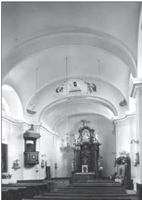
3. Unutrašnjost – pogled na svetište; snimio Fotoarhiv JAZU 30-ih godina 20. st., presnimljeno 1991. g.; inv. br.: 17009; neg.: II-15392