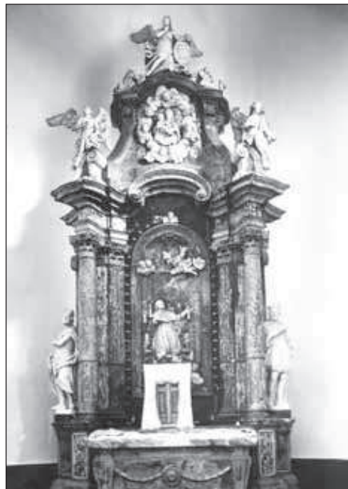
4. Unutrašnjost – oltar sv. Ivana Nepomuka iz zagrebačke katedrale (rađen 1720.), dar kanonika Antuna Zdlučaja. Oltar je posvećen 1795. godine. Kraljevi: sv. Vladimir i sv. Kazimir i Bogorodica; snimio Fotoarhiv JAZU 30-ih godina 20. st.; inv. br.: 17006; neg.: II-15391