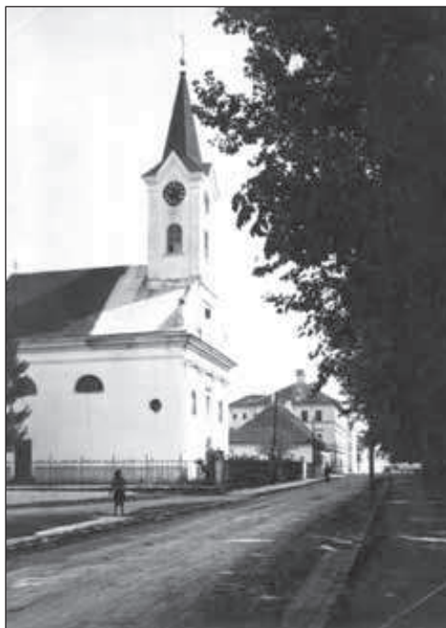
Ilustracija 3. Župna crkva sv. Ivana Nepomuka

1. Vanjština – total; snimljeno prije 1945. g.; inv. br.: 31673; neg.: II-15396