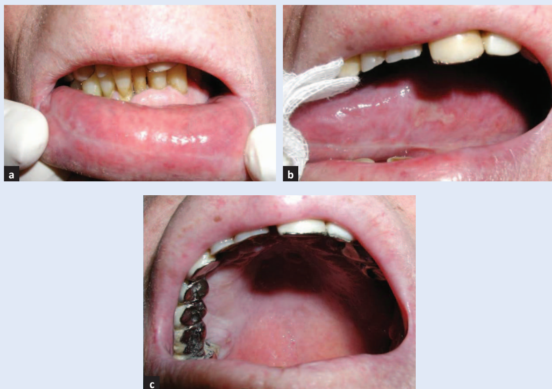
Slika 5. Oralni mukozitis na kontrolnom pregledu nakon 11 dana. a) Sluznica donje usnice bez lezija i upale; b) sluznica lateralnih ruba jezika s erozijom; c) sluznica nepca bez upale.