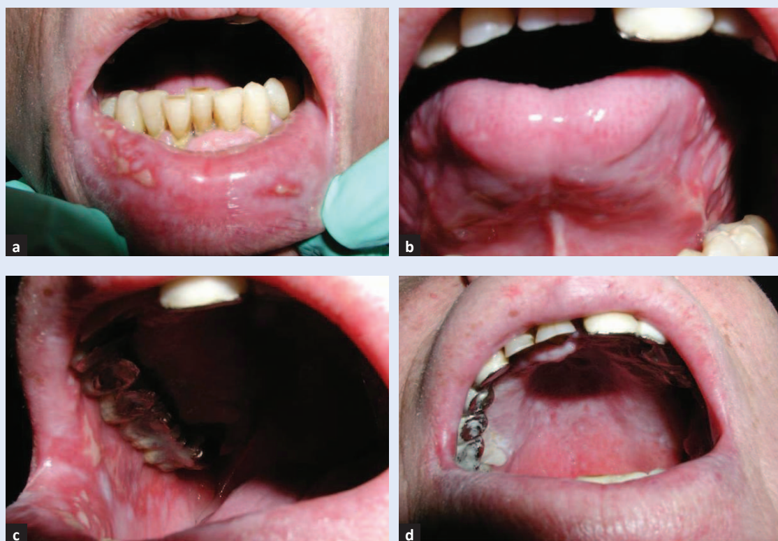
Slika 4. Oralni mukozitis na kontrolnom pregledu nakon 7 dana. a) Sluznica donje usnice s blagom upalom i nekoliko erozija; b) sluznice vrška i lateralnih rubova jezika s blagom upalom i erozijama; c) sluznica obraza s blagom upalom i erozijama; d) sluznica nepca bez upale.