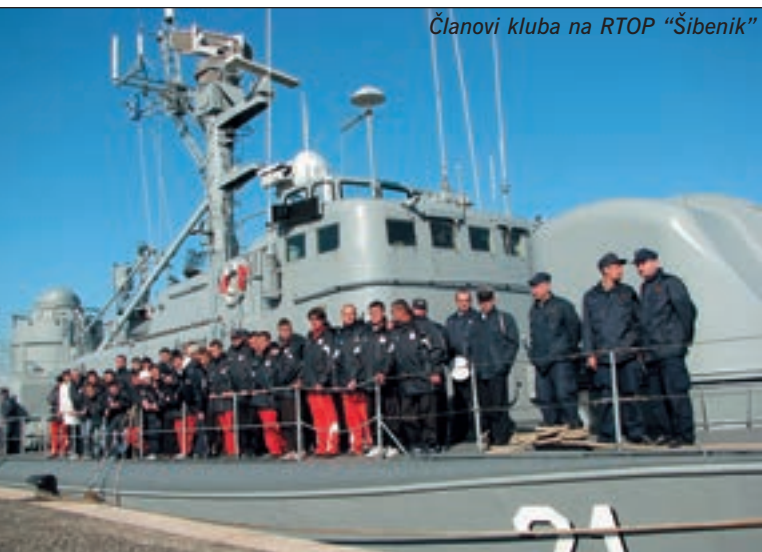
Članovi kluba na RTOP "Šibenik"

U Pomorskoj bazi Lora, od 6. do 15. veljače Hrvatska ratna mornarica bila je domaćin nogometnom klubu Radnički iz Vukovara-Borova naselja, koji je imao pripreme za početak proljetne nogometne sezone vukovarsko-srijemske županijske lige.