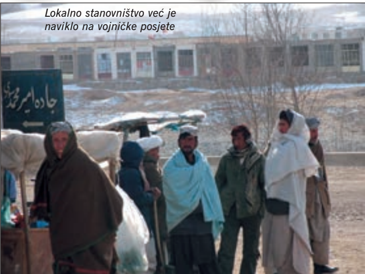
Lokalno stanovništvo već je naviklo na vojničke posjete

Ulazimo u gradić Dowlat Yar. Uz cestu, pred trgovinicama, mnoštvo ljudi. Ne obaziru se previše na nas. Navikli su se. Skrećemo vozeći zaleđenim koritom Hari Ruda. U sjedištu distrikta, dočekuje nas mladi administrator. Zaista je u nezavidnoj situaciji. Treba iz nepreglednog popisa potrebitih odabrati one najpotrebitije. A mi smo se potrudili. Donijeli smo tone najnužnijih namirnica. I ne samo to. U ime hrvatske strane dodijelili smo pregršt utopljenja za policijsku postaju. Vidi se da im je drago. I meni je, kad se može pomoći. Administrator nas nudi čajem i ostavlja na ručku. Od srca je, to se ne odbija. I ako postoje predrasude, guraju se u stranu. A jelo i nije tako loše. Jedino što poslije dva sata sjedenja na vlastitim nogama i nije najlakše ustati. Na kraju, neizbježno slikanje. I dođite nam opet u Dowlat Yar! Mislim da hoćemo, čim otople i čim posjetimo i druge kojima je naš dolazak ponekad posljednja prilika za preživljavanje zime. ■