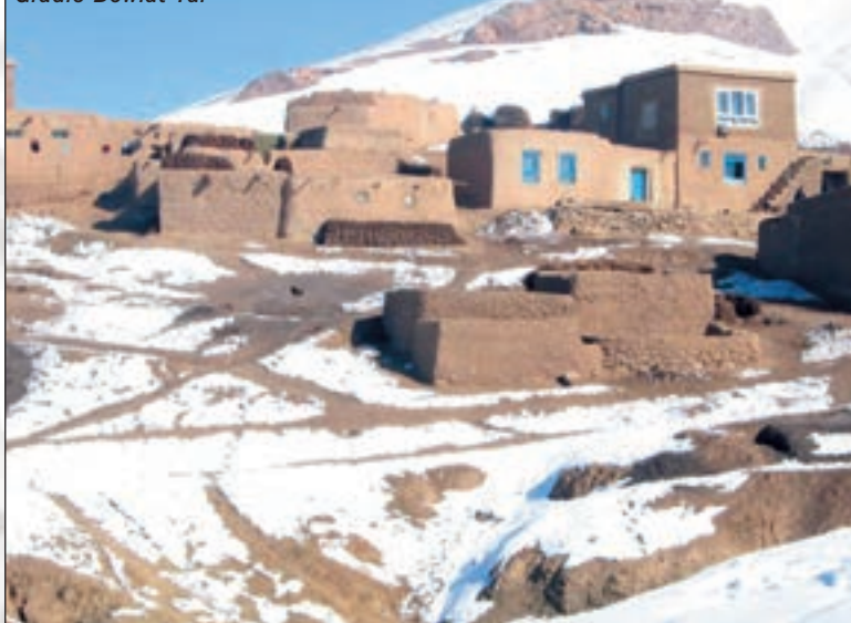
Gradić Dowlat Yar