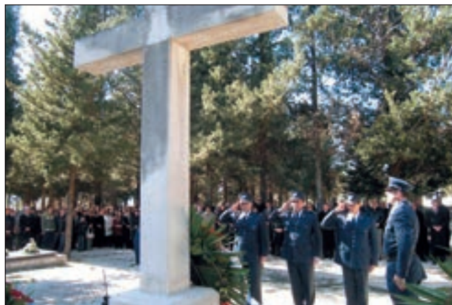
■ Ispred središnjeg križa i na grobnicama branitelja vijence su položila brojna izaslanstva

Na kraju svečanosti, najboljim pripadnicima postrojbe predane su pohvale i nagrade. ■