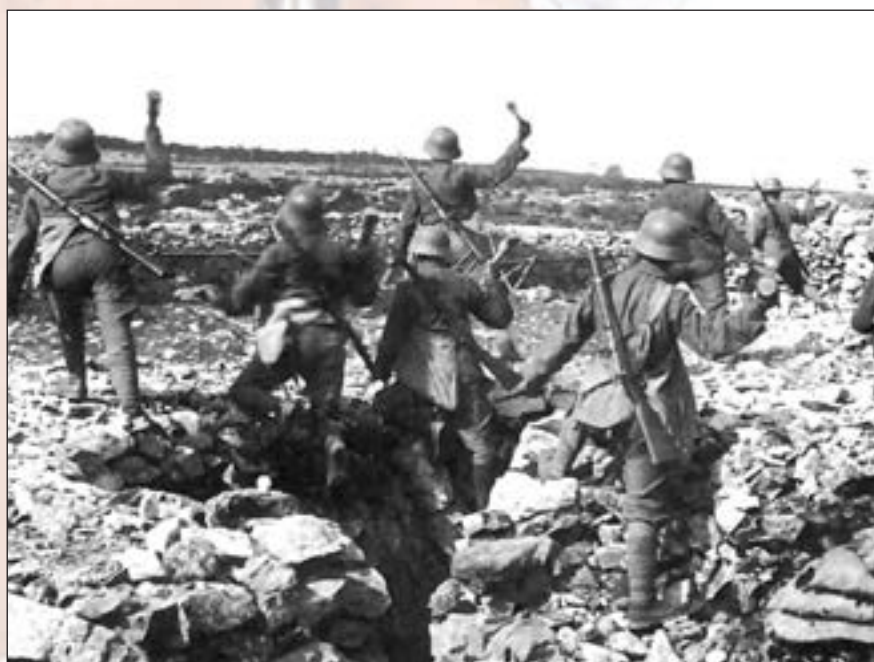
■ Austrougarski vojnici na Sočanskom bojištu 1917.

krić je ušao u vojsku Kraljevine SHS/Jugoslavije. Umirovljen je 1941. kao pukovnik Oružanih snaga Nezavisne Države Hrvatske, a umro je 1961. godine. ■