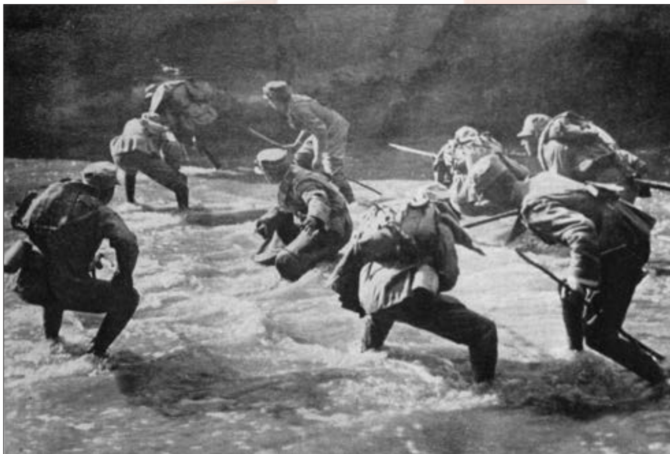
■ Talijanski vojnici prelaze rijeku pod neprijateljskom paljbom

ju uz rijeku. Iskrić se sa svojim postrojbama morao povući na pričuveni položaj na drugoj liniji. Ondje ga ni izravni topnički napadi ni beskonačni talijanski juriši nisu mogli prisiliti na uzmak, pa čak ni onda kada su oba obrambena krila bila opkoljena. Kada su pristigla talijanska pojačanja, dok je broj žrtava na austro-ugarskoj strani stalno rastao, položaj hrabrih branitelja postao je beznadan. Brigadni zapovjednik dopustio je Iskriću da se povuče, ali on mu je, prije nego što se po tko zna koji put prekinula telefonska linija, odgovorio: "Nikada!" Tijekom dana Talijani su uspjeli osvojiti i obližnje sjeverne položaje. Stoga je austrougarski protunapad u donjem dijelu mjesta Avce, gdje je preostala samo trećina branitelja, postao uistinu nemoguć. Brigadni zapovjednik je zapovjedio povlačenje tijekom sljedeće noći, ali je nagradio satnika Iskrića zbog hrabrosti i postojanosti svih postrojbi pod njegovim zapovjedništvom u teškoj bitki. Ipak, Iskrić je svoje odličje primio