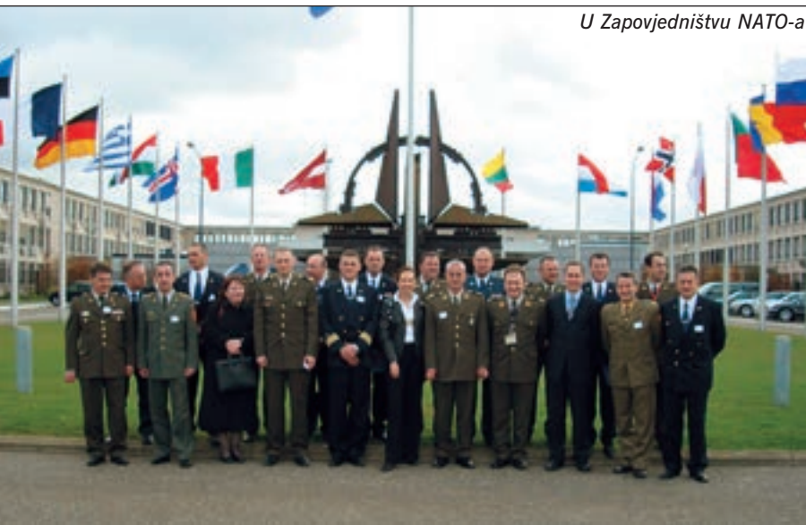
U Zapovjedništvu NATO-a

Vojnog muzeja nakon toga bio je posebno dojmljiv.