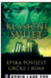
ROBIN LANE FOX

Dotičući se slavni ličnosti poput Homera, Sokrata, Aleksandra, Julija Cezara, Augusta i prvih kršćanskih mučenika, istražujući slobode, pravdu i raskoš, knjiga "Klasični svijet" iznimno vješto i studiozno opisuje turbulentnu povijest Grčke i Rima.