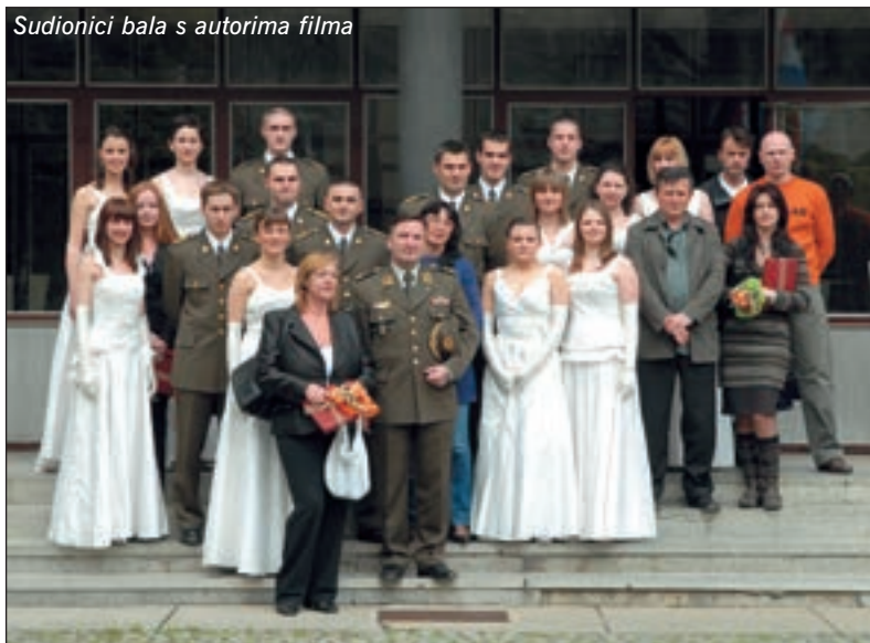
Sudionici bala s autorima filma

strijskim kolegama, sudjelovali u svečanom mimohodu na otvorenju bala i uz taktove Jelačićeva marša pokazali i svoje plesno umijeće. Na filmu su, budući da je Kirin glavne glumce pratio od samog polaska iz Zagreba, zabilježene i mnoge druge zanimljive pojedinosti, službena i neslužbena druženja, pripreme koje su prethodile središnjoj svečanosti, ali i opuštenu atmosfera nakon nastupa. Film je tako pokazao i dugu stranu vojnog poziva, zanimljiviju, ležerniju, ali ništa manje zahtjevnu jer se i u takvim, glamuroznim događanjima predstavljaju oružane snage kojima pripadate.