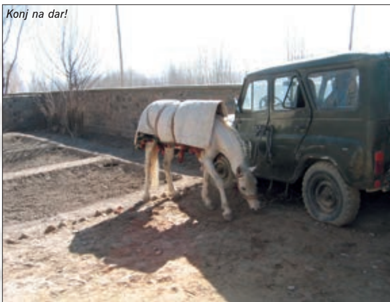
Konj na dar!