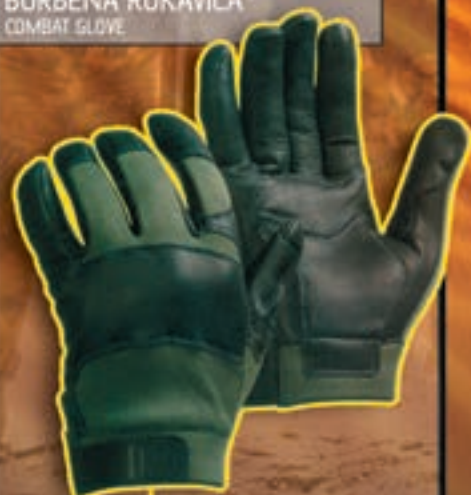
BORBENA RUKAVICA COMBAT GLOVE