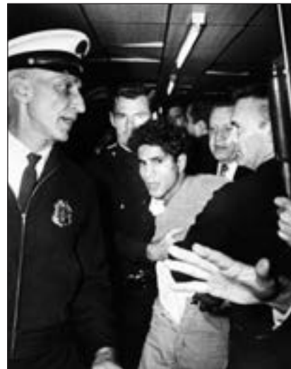
■ Atentator Sirhan Sirhan bio je nezadovoljan američkom potporom Izraelu

dyjevih suradnika uspjelo ga je brzo svladati i razoružati. Prema izjavama nekih svjedoka ubojstva, Sirhan je neposredno prije atentata viknuo: "Kennedy, kučkin sine!"