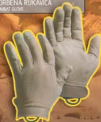
BORBENA RUKAVICA COMBAT GLOVE