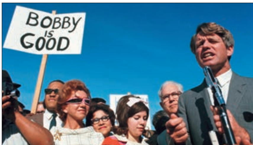
■ Roberta Kennedyja mnogi su smatrali nasljednikom starijeg brata Johna

Na području vanjske politike, Robert Kennedy je nadgledao aktivnosti CIA-e uoči operacije u Zaljevu svinja na Kubi, a tijekom Kubanske krize 1962. također je imao važnu ulogu. Njegovi susreti sa sovjetskim diplomatima, koji su se odvijali iza kulisa diplomacije, imali su veliku važnost u postizanju kompromisa i u