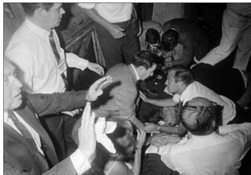
■ Neposredno nakon atentata u losangeleskom hotelu

nu, u kojoj bi sudjelovao i Vijetkong. Vrhunac političke karijere postigao je u svibnju 1968., objavivši kandidaturu za demokratsku predsjedničku nominaciju. Tijekom borbe za glasove Robert Kennedy je odnio nekoliko važnih političkih pobjeda i figurirao kao najizgledniji kandidat Demokratske stranke za Bijelu kuću.