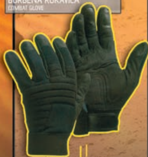
BORBENA RUKAVICA COMBAT GLOVE