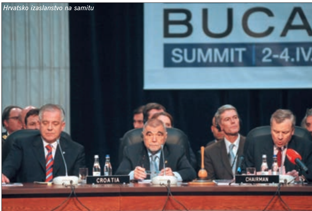
Hrvatsko izaslanstvo na samitu

mo formalno povećanje nego i "daljnje ojačavanje sposobnosti Saveza da se suprotstavi postojećim i potencijalnim prijetnjama sigurnosti u XXI. stoljeću". Inače, naš pristup bit će šesto širenje NATO-a. Bugarska, Estonija, Latvija, Litva, Rumunjska, Slovenija i Slovačka priključile su se 2004., Češka, Mađarska i Poljska 1999., Španjolska 1982., Njemačka 1955., a Grčka i Turska 1952.