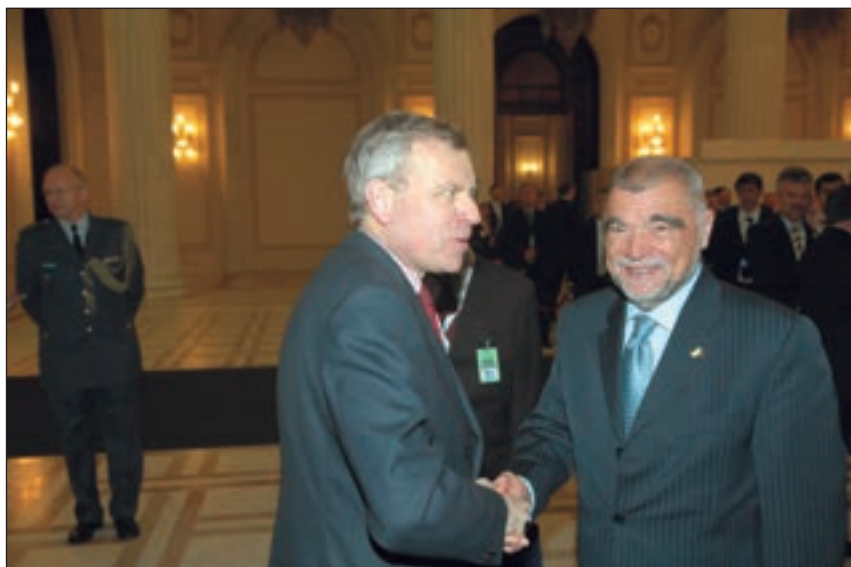
■ Čestitke na pozivu u NATO primili su od glavnog tajnika NATO-a hrvatski predsjednik Stjepan Mesić i premijer Ivo Sanader

azijskoj zemlji. Općenito, NATO je u Bukureštu vrlo često spominjao svoju suradnju s UN-om i potrebu za njezinim daljnjim ojačavanjem.