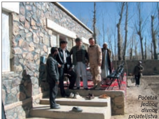
Početak jednog divnog prijateljstva

Stržar Odjela za poljoprivredu, provincijskog ministarstva, maše nam rukom da uđemo u dvorište. Pozdravi. Ubrzo se u dvorištu našlo cijelo mnoštvo, koje je začas ispraznilo naša vozila. Tamo na terasi, prostrt debeli tepih i čitav niz stolaca. Pojavio se i dobroćudni šef Od-