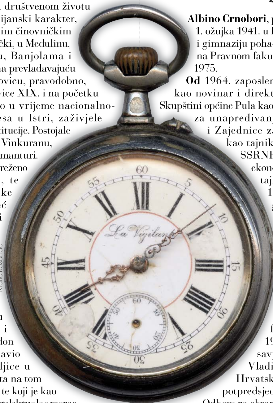
(Iz zbirke Marija Rosande)

Bio je među osnivačima Pododbora Matice hrvatske u Puli (1964.) i član uredništva časopisa Istarski mozaik , te glavni tajnik Čakavskog sabora (1975.-1978.) i član uredništva edicije Istra kroz stoljeća Čakavskog sabora, a obnašao je i političke funkcije u društveno-političkim organizacijama,