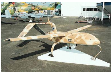
Slika 3: Firebird 2001 (URL 7)

Od 1970-ih uvelike se unaprjeđuju UAV sustavi. Najviše u vidu trajanja leta i pogona letjelica. Od 1990-ih do danas iskristalizirala se uloga promatrača okoliša na Zemlji u vidu predstavnika Firebird 2001 (Izrael) (Slika 3), RQ-1 Predator (SAD), Helios (SAD). Helios (Slika 4) bespilotna letjelica je za sada u razvoju, a imati će i sustav ćelija za gorivo kako bi pohranom energije osigurao snagu za letenje i preko noći. U sljedećih 10 godina očekuje se da će letjelica Helios biti široko rasprostranjena kao širokopojasna komunikacijska platforma pružajući jedinstveno isplativo upotpunjavanje satelitskih i zemaljskih komunikacijskih sustava (Pavlik i dr. 2014).