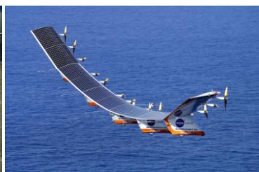
Slika 4: Helios (URL 4)