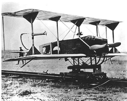
Slika 1: Hewitt-Sperry Aerial Torpedo (URL 3)

Prva pojava bespilotnih sustava seže u daleku 1845. godinu, kada su Austrijanci napadali Veneciju s balonima koji su nosili eksploziv. Godine 1917. Elmer Sperry izumio je prvi automatski žiroskopski stabilizator, što je potaknulo razvoj letjelica pa je tako prvi radijski kontrolirani let bio onaj letjelice Hewitt-Sperry Aerial Torpedo (Slika 1). Hewitt-Sperry Aerial Torpedo letio je oko 80 km noseći 140 kg bombi u nekoliko probnih letova, ali nikada nije bio u ratnoj borbi. Izum žiroskopskog stabilizatora pomogao je u održavanju stabilizacije i razine leta. Temeljem ovog tehnološkog iskoraka Sperry uspješno transformira SAD-ov Navy Curtiss N-9 zrakoplov za treniranje u prvi radijski kontrolirani UAV (URL 3).