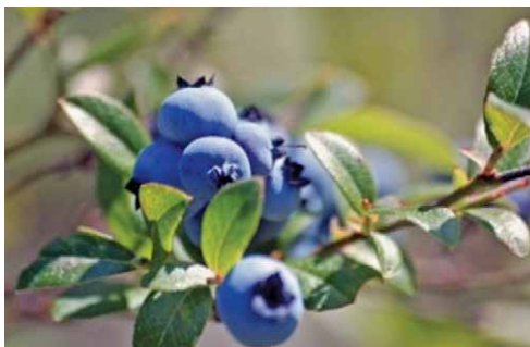
Slika 11. Niskogrmolika borovnica – Vaccinium angustifolium Aiton (26)