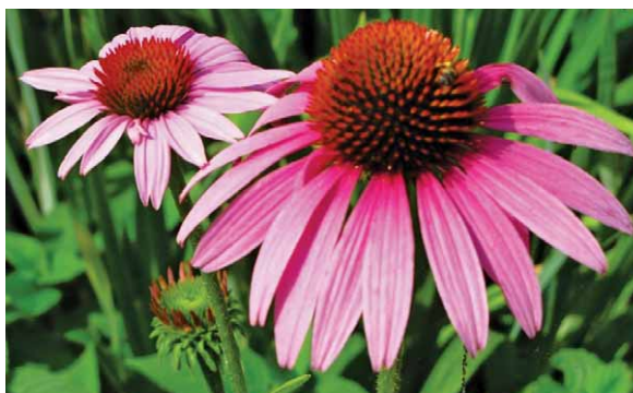
Slika 6. Crvena (grimizna) rudbekija – Echinacea purpurea (L.) Moench (16)

Poznata kao ukrasna biljka, crvena (grimizna) rudbekija, Echinacea purpurea (L.) Moench iz porodice Asteraceae također se preporučuje u liječenju gingivitisa (slika 6.). Ova biljka djeluje antibakterijski i jača imunološki sustav (3). Tinktura rudbekije dodaje se čajevima za liječenje gingivitisa i vodama za ispiranje usta. Može izazvati peckanje i utrnuće jezika, ali ta je pojava posve bezopasna (14).