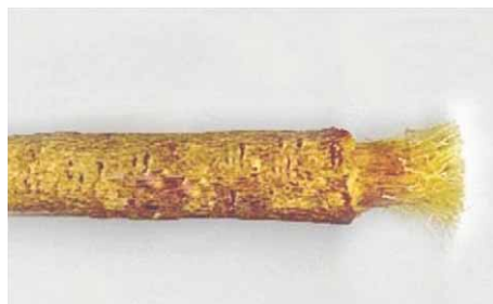
Slika 10. Kora vrste Salvadora persica L. (24)