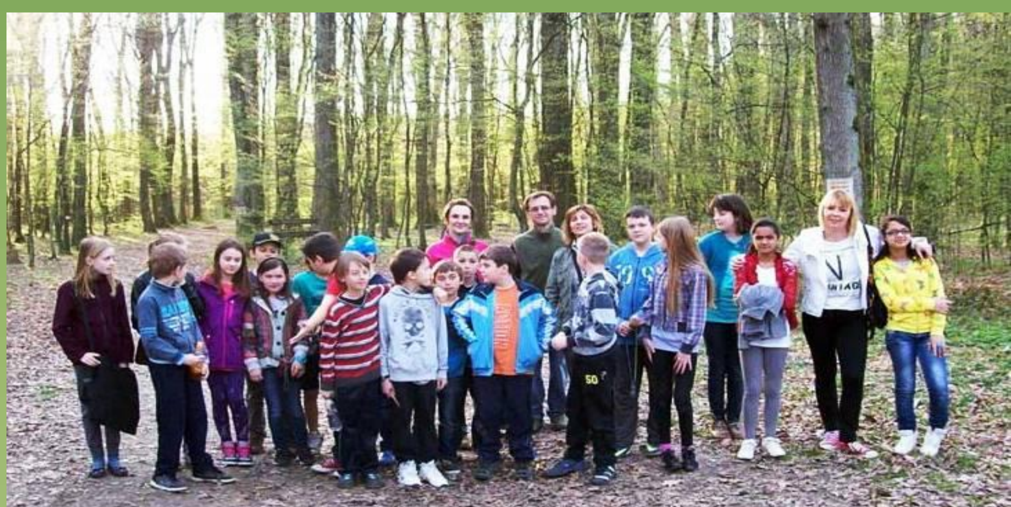
Sudionici projekta „Šuma u školi, škola u šumi“.

Sve veća urbanizacija, klimatske i brojne druge promjene u okolišu naša su svakodnevnica. Stoga su spoznaje o ulozi i važnosti šuma sve veći, a time i potreba za učenjem o šumskim ekosustavima. Ključni alat u prenošenju znanja o šumama i njihovoj važnosti je tzv. šumska pedagogija. Ova relativno mlada disciplina tek dobiva svoje mjesto u našim obrazovnim programima. Najrazvijenija je u skandinavskim zemljama te u Austriji, Njemačkoj i Švicarskoj. Namijenjena je prvenstveno djeci i mladima, a služi se raznim osjetilnim metodama (potpunijem doživljavanju šume putem zvukova, zatvorenih očiju, raspoznavanjem vrste drveća po kori, listu i češeru, praćenjem životinjskih tragova i savladavanjem neravnog šumskog terena), s ciljem doživljajnog učenja o važnosti šume i šumskih ekosustava. Primjenom šumske pedagogije djeca na edukativan i zabavan način uče i razvijaju odgovoran odnos prema šumskim zajednicama.