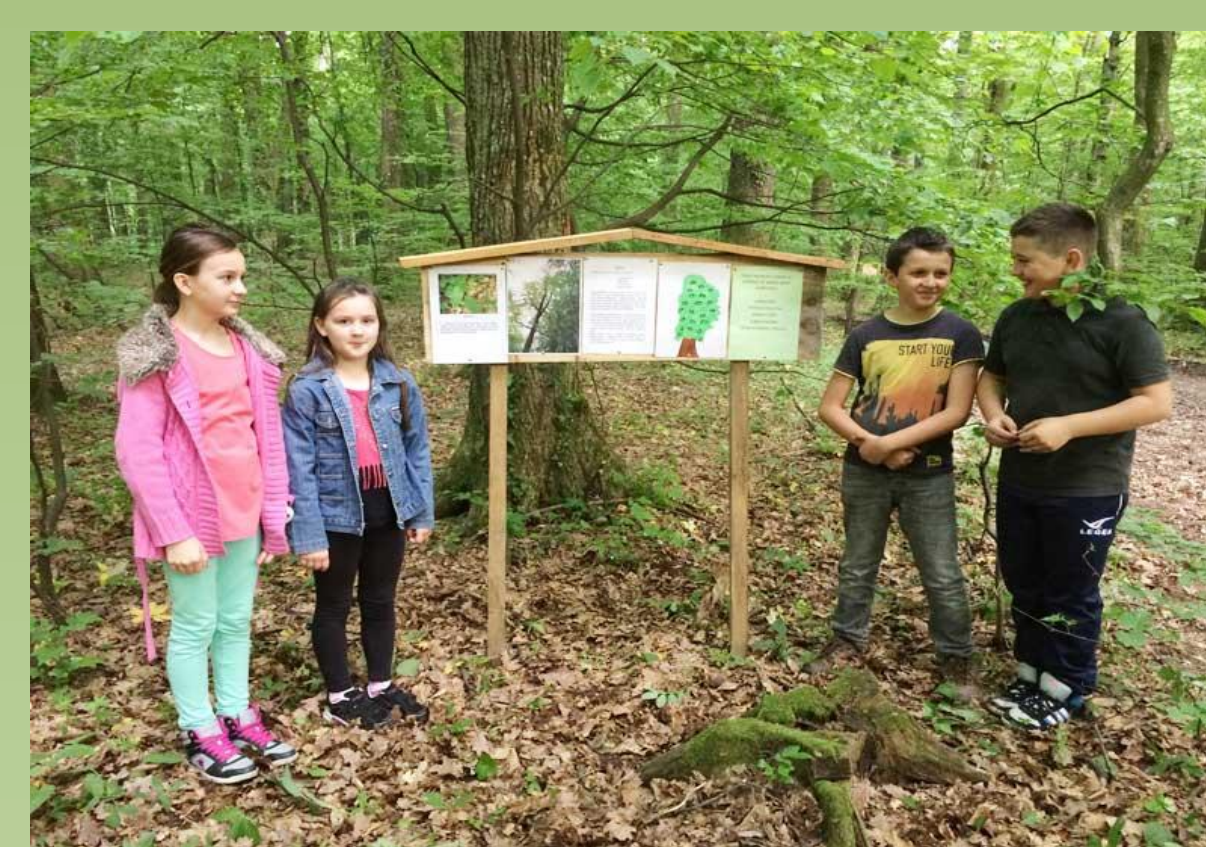
( http://portal.hrsume.hr/index.php/hr/turizam/kola-u-umi ).

Rezultati intervjua prije provedenih aktivnosti vezanih uz šumski ekosustav ukazali su na nedovoljno znanje o uzgoju i zaštiti šuma, dok su rezultati nakon provedenih edukativnih aktivnosti bili statistički značajno bolji. Ukupno su učenici 1. i 4. razreda nakon održanog integriranog dana i provedene terenske nastave u šumi dali 96% točnih i 4% netočnih odgovora o uzgoju i zaštiti šuma, za razliku od intervjua prije održanih aktivnosti kada su dali svega 56% točnih i čak 44% netočnih odgovora.