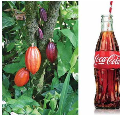
Slika 2. Izgled boce Coca-Cole inspiriran plodovima kakaovca (7)