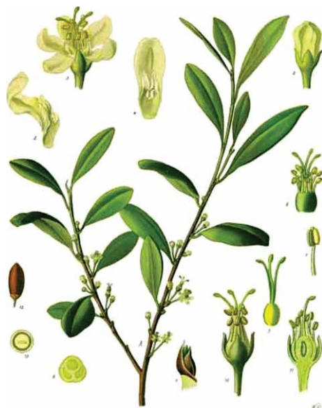
Slika 3. Erythroxylum coca Lam., Erythroxylaceae (8)

Drogu čine osušeni listovi uzgojene koke, a karakterizira ih raznolik sastav alkaloida od kojih je najbitniji kokain, neurostimulirajuća sastavnica, ilegalna u većini zemalja svijeta, pa tako i u Republici Hrvatskoj (10). Kao izvor droge koriste se obje vrste koke, a razlikuju se tri različita varijeteta: E. coca var. coca , poznat kao bolivijanska ili huanako-koka, te dva varijeteta vrste E. novogranatense : E. novogranatense var. novogranatense , kolumbijska koka i E. novogranatense var. truxillense , tzv. peruanska ili truxillo-koka. Udio raznih alkaloida, pa tako i kokaina je različit ovisno o pojedinom varijetetu, a temelj njihova međusobnog raspoznavanja su oblik i boja listova.