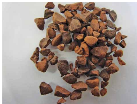
Slika 6. Colae semen (23)