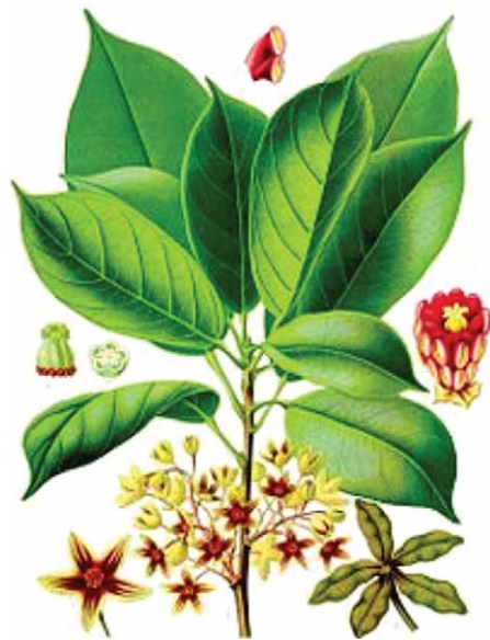
Slika 5. Cola acuminata (Pal. de Beauv.) Schott et Endl. (20)

Droga – Colae semen (slika 6.) (23) sastoji se od osušenih sjemenaka različitih Cola vrsta, osobito C. nitida i C. acuminata , i to uglavnom od usitnjenih supki, dok je sjemena lupina redovito uklonjena. Plodovi se skupljaju nedozreli,