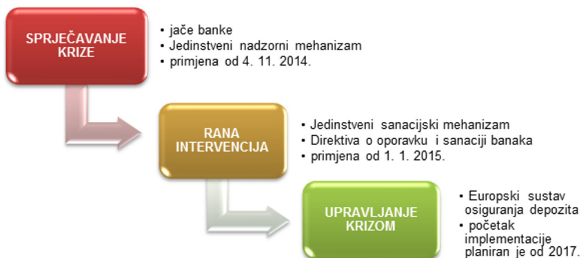
Shema 1. Stupovi bankovne unije

Bankovna unija temelji se na tri stupa. Prva dva su usmjerena na otklanjanje kriznih momenata i primjenjuju se od kraja 2014. godine, odnosno od početka 2015. godine. Treći stup bankovne unije planira se implementirati početkom 2017. godine. Svaki od njih djeluje u smjeru osposobljavanja financijskog tržišta za spremnije reagiranje na financijske krize u budućnosti stvaranjem jedinstvenih mehanizama i promjenama kriterija u Direktivama. Dovršetak bankovne unije zahtijeva provedbu navedenog hodograma unutar definiranog zakonodavnog i pravnog okvira te implementaciju daljnjih mjera za jačanje financijske stabilnosti. Novi financijski europski okvir uključuje sve zemlje europodručja, kao i one države članice EU-a koje se priključe bankovnoj uniji uspostavljanjem mehanizma o bliskoj suradnji. Hrvatska, kao i preostalih osam država članica EU-a koje nisu prihvatile zajedničku europsku valutu, zasad nisu dio bankovne unije. Države izvan europodručja primjenjuju jedinstvena regulatorna pravila u smislu nadzora i sanacije banaka, ali ne sudjeluju u jedinstvenim mehanizmima nadzora i sanacije.