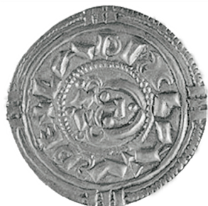
Denar ugarskog kralja Ladislava I (1072–1095). Nalazište Tompojevci kod Vukovara

Slično bizantskom zlatniku na jugu, ugarski srebrnjaci pokazuju ekonomski jači utjecaj ugarskih vladara na sjevernim hrvatskim prostorima. Prisutni su na raznim arheološkim nalazištima bjelobrdske kulture. Ugarski denari su u opticaju u srednjovjekovnoj Slavoniji od vremena kralja sv. Stjepana I. (997–1038), pa sve do kraja 12. i početka 13. stoljeća kada se kuje prvi hrvatski autonomni novac, hrvatski frizatik hercega Andrije (1196–1204).