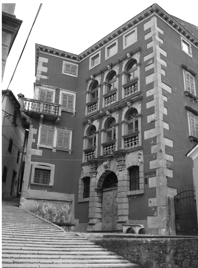
Sl. 12. Palača Battiala Lazzarini, Labin

na žbukanoj crvenoj fasadi. Naglasak je na rustikom oblikovanom portalu, no hijerarhija otvora prizemlja negirana je ravnomjernim ponavljanjem lučno zaključenih velikih prozora dva piana nobile , s balustrima u donjoj zoni i skulpturalnom izražajnim ljudskim glavama u ključnom kamenu. Iza monumentalne fasade reprezentativne su prostorije sa stubištem smještenim u stražnjem dijelu kuće, s kamenim okvirima otvora prema dvoranama, pa se mletački model osjeća i u prostornoj organizaciji, naravno, prilagođenoj nepravilnom i neravnom terenu.