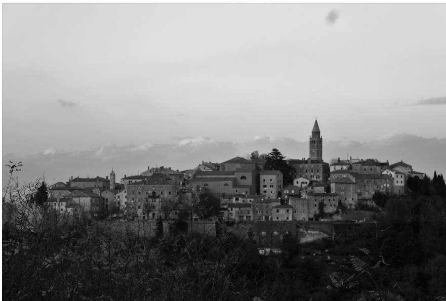
Sl. 1. Pogled na Labin (fotografirala Jasenka Gudelj, 2017.)

Povijesna jezgra staroga Labina jedna je od najvrednijih urbanih cjelina Istarskoga poluotoka, a sačuvanost kako arhitektonskih ostvarenja tako i arhivskih fondova iz vremena mletačke dominacije (1420. – 1797.) omogućuje analizu graditeljske baštine u društveno-povijesnome kontekstu. Dinamična ranonovovjekovna intelektualna i kulturna klima grada na granici s habsburškim posjedima te dugo trajanje institucija komune i plemićkih obitelji odlike su labinskoga društva, koje tijekom stoljeća gradi i oprema svoje prostore obraćajući se lokalnim i dovedenim majstorima, dok se kamen iz lokalnog kamenoloma u Presiki izvozi i na drugu obalu Jadrana. Cilj je, stoga, ovoga rada ocrtati odnos arhitektonskih ostvarenja i ranonovovjekovnih kolektivnih i pojedinačnih naručitelja te istražiti podatke o profesijama vezanim za graditeljstvo na području Labina u promatranom razdoblju.