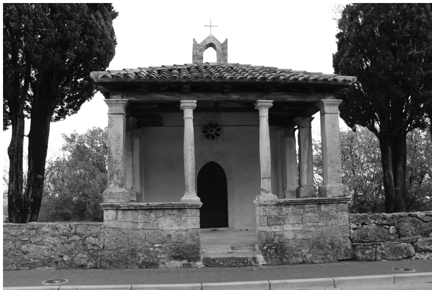
Sl. 11. Kapela sv. Marije Magdalene, Labin