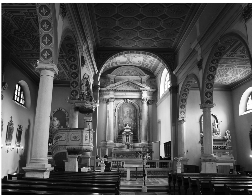
Sl. 8. Unutrašnjost župne crkve Uznesenja Blažene Djevice Marije, Labin

Možda su dijelovi intervencija koje su rezultirale lijepa rozeta na pročelju i šiljati luk nekadašnjeg portala, iako je moguće da pripadaju i nekoj ranijoj fazi građevine. Krajem drugog desetljeća XVI. stoljeća izgrađena je sakristija, o čemu svjedoči razmjena pisama između podestata Urbana Bollanija i puljskog biskupa Altobella Averoldija iz 1518. 436