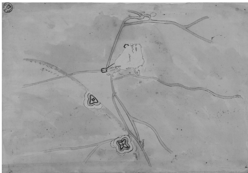
Sl. 2. Plan zidina Labina s projektom novih fortifikacija, oko 1550.

vojno-političkoj situaciji i napretku ratne tehnike i tehnologije. Investicija su centralne vlasti i komune, a inženjeri su poslani iz Venecije. Zatečene medijevalne zidine popravljale su se već sredinom XV. stoljeća jer je u srpnju 1451. dužd Francesco Foscari (na dužnosti od 1423. do 1457.) odobrio podestatu Marcu Magnu (1449. – 1451.) trošak od 200 lira na pet godina za popravak gradskih zidina. 390 Giuseppe Caprin čak piše da je podignuto pet kvadratnih kula povezanih kurtinama s kruništima, što, iako ne navodi izvor za svoju tvrđnju, može biti prihvaćeno s obzirom na zabilježen izgled labinskih zidina stoljeće kasnije. 391