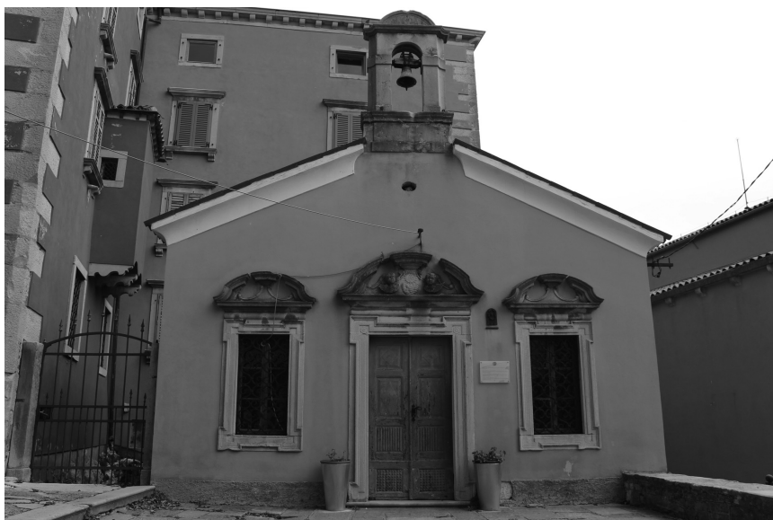
Sl. 13. Kapela sv. Stjepana, Labin

Kako svjedoče nadgrobne ploče, Battiale su kao svoju obiteljsku kapelu oblikovale onu sv. Stjepana u neposrednoj blizini palače, čije pročelje također pokazuje odlike dekorativnog jezika XVIII. stoljeća, s pravokutnim otvorima s naglašenim uglovima i razvijenim isprekidanim zabatima. 463 Ponovno, i ove se kvalitetne dekoracije i dvije andeoske glave odmiču od oblikovnih principa profilacija prozora i figura glava na palači, pa su vjerojatno djelo nekih drugih izvođača.