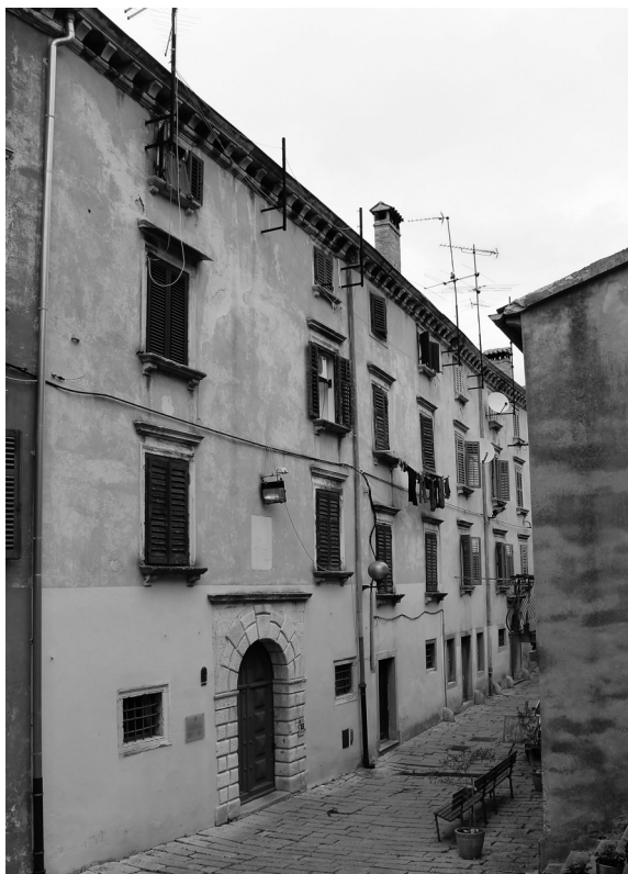
Sl. 14. Kuća Negri, Labin

čije je oblikovanje ipak jednostavno i oslonjeno tek na profilirane volute konzola. U toj su kući odsjedali mletački dužnosnici u proputovanju Labinom: primjerice, 29. studenog 1587. terminacija Nicolòa Salamona o sječi stabala pročitala se u dvorani kuće Negri, gdje je Salamon bio odsjeo 465 , dok naš mletački inženjer prvih godina Seicenta hvali udobnost Negrijeve, pa tako i drugih kuća u gradu. Tranquillo Negri dat će podignuti kapelu u neposrednoj blizini palače obitelji 1620., i to za bratovštinu sv. Antuna Padovanskog, no crkvice posvećena Gospi od Karmela funkcionirala je kao kapela obitelji, pa je za nju naručena i oltarna pala već spomenutog udomaćenog slikara Moreschija. 466