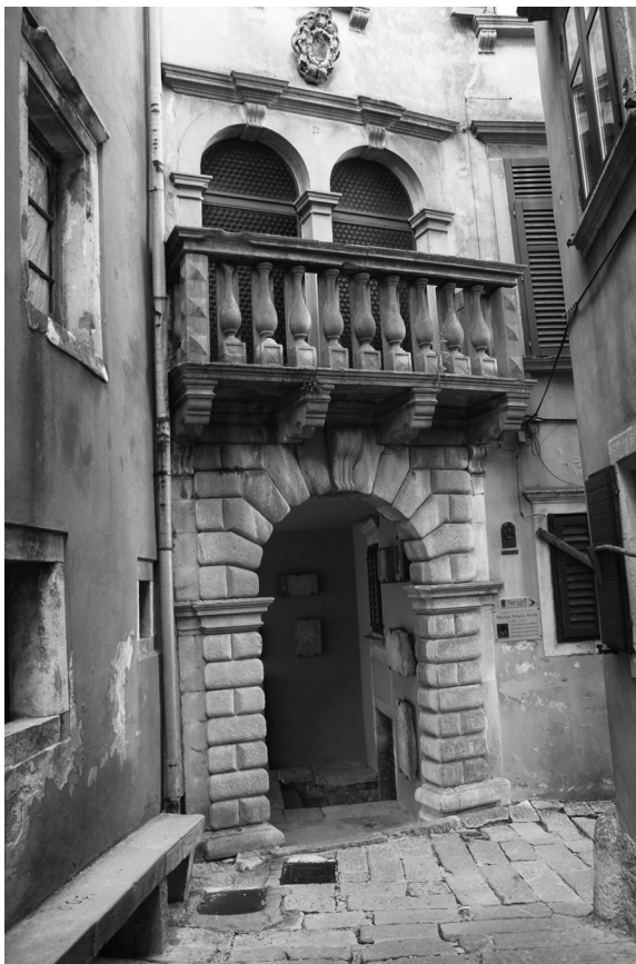
Sl. 15. Kuća Franković-Vlačić, Labin