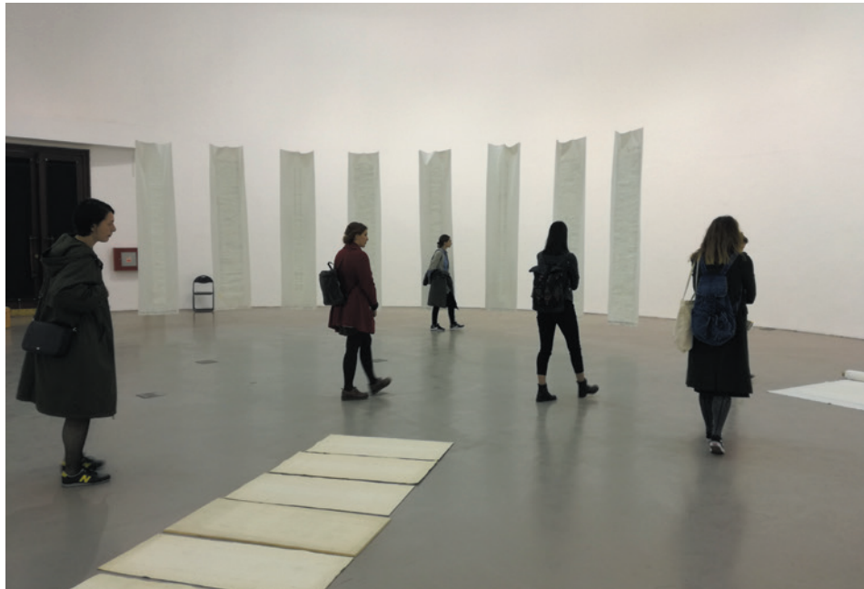
Dom HDLU-a, na izložbi Janje moje malo s Ivet Ćurlin, kustosicom WHW-a