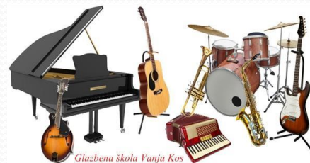
Glazbena škola Vanja Kos